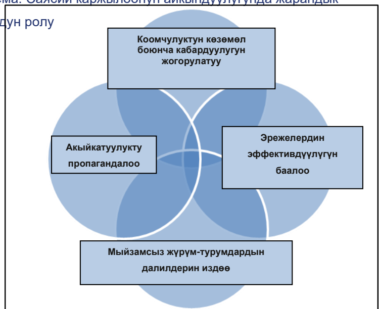
6-схема: Саясий каржылоонун айкындуулугунда жарандык коомдун ролу

Хотя официальные правила, которые хорошо соблюдаются компетентным государственным учреждением, важны для контроля денег в политике, опыт показывает, что этого никогда не бывает достаточно в вакууме. Другие заинтересованные стороны должны играть активную роль в наблюдении за тем, как денежные потоки поступают в политическую систему и из нее. Естественно, что политики и политические партии играют решающую роль в оперативном реагировании, но усилия по повышению прозрачности в политическом финансировании не могут ждать, пока те, кто участвует, не изменят свое поведение.