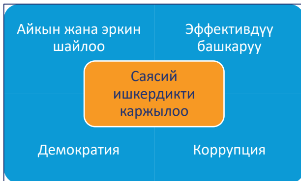
Схема 1: Саясий иш чараларды каржылоо азыркы коомдун негизги аспектери менен тыгыз байланышта.

Акча саясатта керектүү нерсе, бирок көйгөйдү нерсе, биз акчанын пайдалуу жактарын өнүктүрүү менен анын таасирин контролоо жолдорун жана жаман таасирин карап чыгышыбыз керек. Бардык өлкөлөргө туура келе турган көзөмөлдөө модели жок. Ар кайсы өлкөлөрдүн койгон максаттары жана иш чаралары жалпы контексте бааланышы керек. Бирок бул, ар бир өлкө башка өлкөлөрдүн кетирген каталарында тыянакка келе албайт.