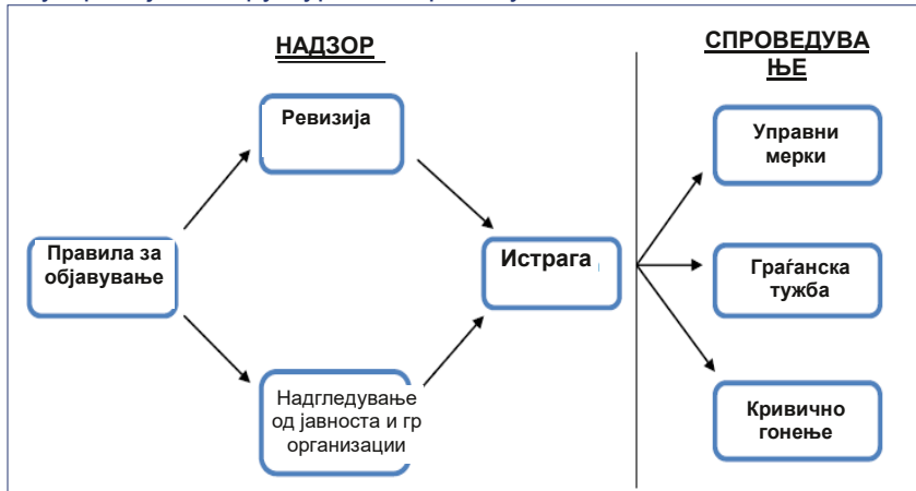
Илустрација 4: Структура на спроведувањето

не се доволни за постигнување транспарентност во политичкото финансирање.