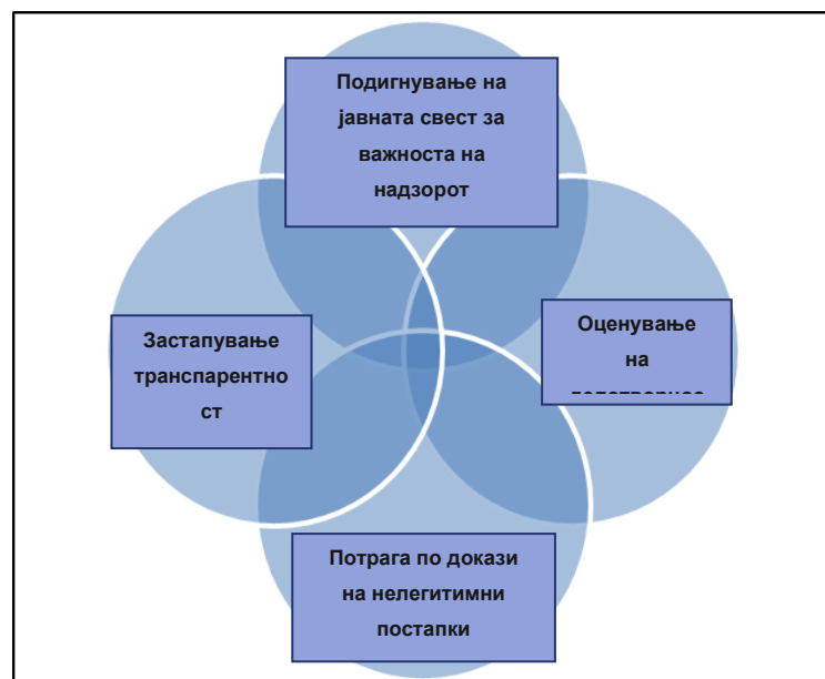
Илустрација 5: Улоги на граѓанското општество во подобрување на транспарентноста на политичките финансии

Иако формалните прописи што добро се спроведуваат од страна на една способна државна институција се важни за контрола на парите во политиката, искуството покажува дека тоа никогаш не е доволно во вакуум. Другите засегнати чинители треба да преземат активна улога во надгледувањето на протокот на парите во и надвор од политичкиот систем. Секако, политичарите и политичките партии имаат клучна улога да постапуваат одговорно, но напорите за зголемување на транспарентноста во политичкото финансирање не можат да чекаат додека вклучените лица не го променат своето однесување.